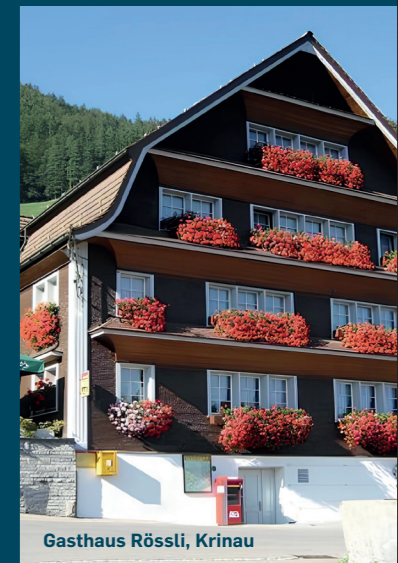
Gasthaus Rössli, Krinau

Diese Beispiele zeigen, dass bei einer Gemeindevereinigung mit einer guten Zusammenarbeit und gegenseitigem Verständnis durchaus neue Entwicklungen möglich sind. Die Solidarität kann damit über die eigenen Grenzen hinauswachsen.