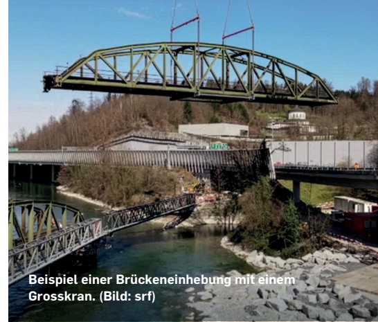
Beispiel einer Brückeneinhebung mit einem Grosskran.

Am Dienstag, 30. Juni 2026, wird die neue Brückenverbindung in einem präzisen Manöver eingesetzt. Die massive Stahlbaukonstruktion wird in einem Stück angeliefert und eingehoben. Mit einer Länge von 47 Metern und einem Gewicht von rund 70 Tonnen stellt das Bauteil höchste Anforderungen an die Logistik und die Präzision der Fachkräfte. Um diese Last sicher zu bewegen, kommt schweres Gerät zum Einsatz. Der Hauptakteur ist einer der leistungsstärksten Mobilkrane der Schweiz. Der Einhub erfolgt von der Seite des BWZT aus.